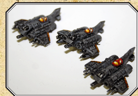
Escuadron de Apoyo Aéreo.