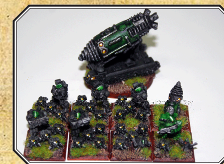
Primera Escuadra Verde-1.