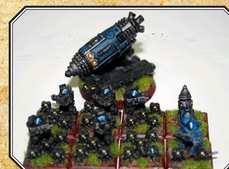
Tercera Escuadra Azul-1.