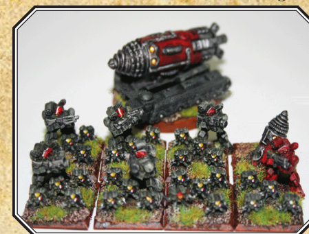
Segunda Escuadra Rojo-1.