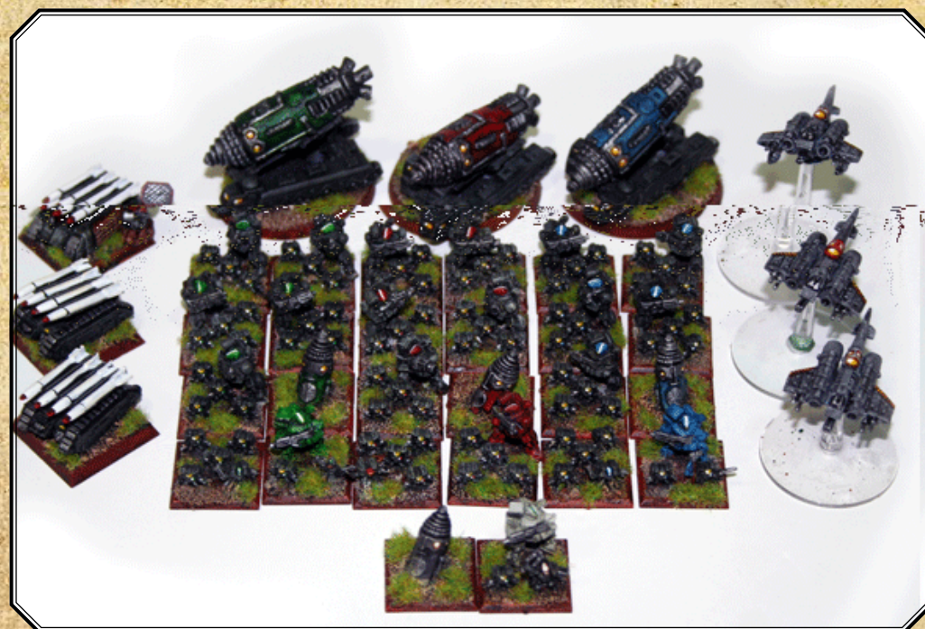
Compañía Los Conquistadores de Aguirre.

<transmisión finalizada Inquisidor Mayor Arnihus Maëllor>