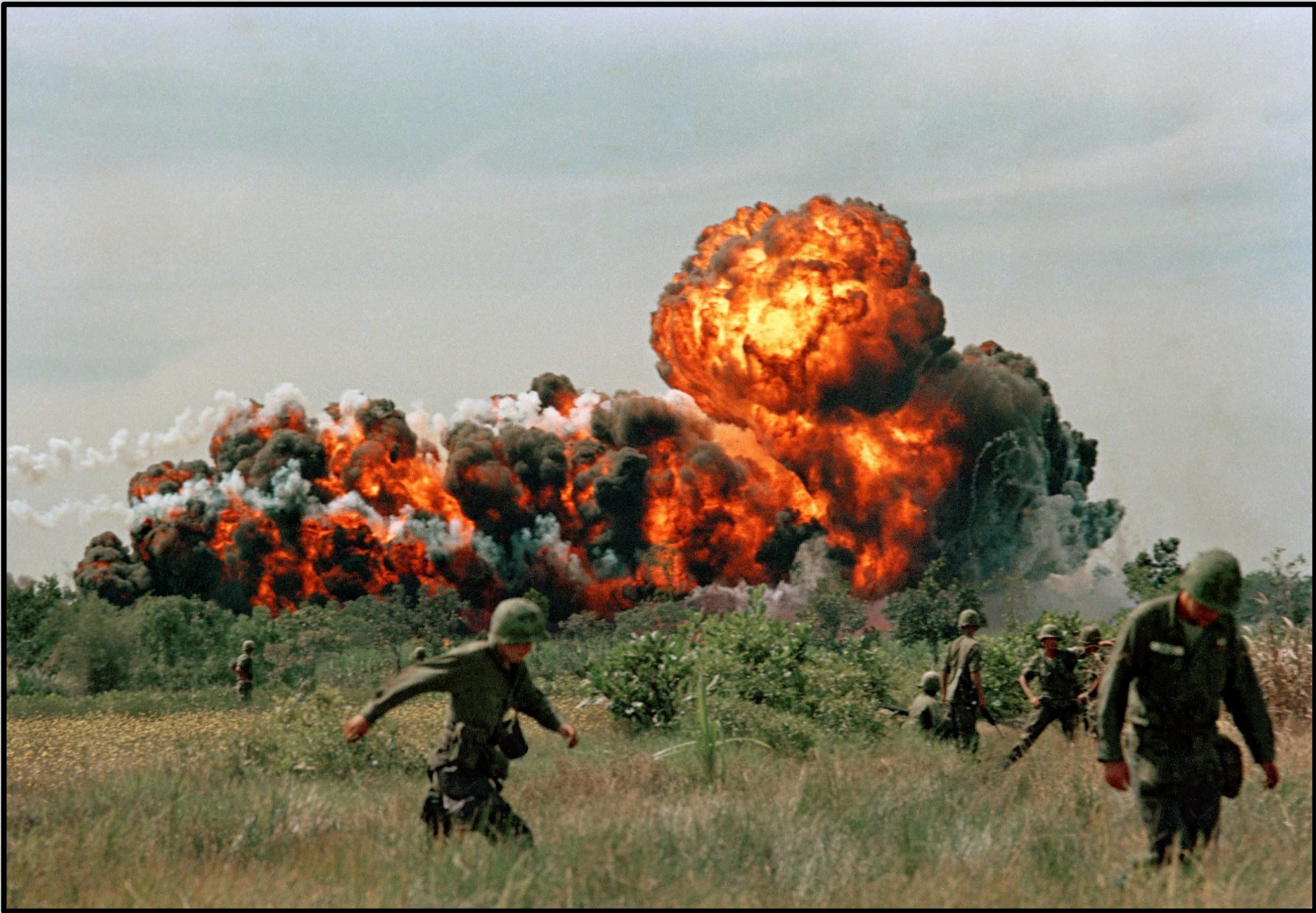
Foto: El ejército mercenario de “La Duquesa” se retira hacia el interior de su territorio