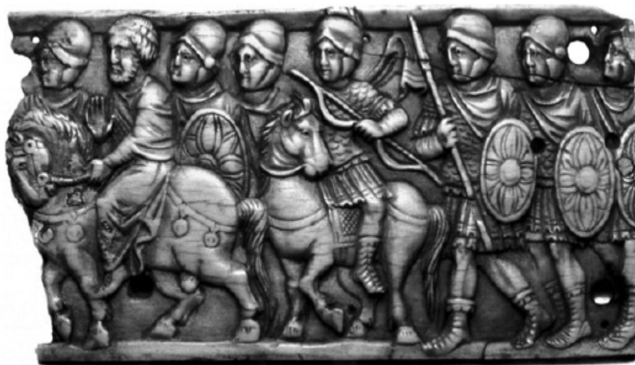
Bajorrelieve egipcio de marfil que muestra un arquero montado e infantería, todos ellos con armadura.

Los arqueros actuales [toxotai] entran en batalla portando coseletes y equipados con grebas que llegan a las rodillas. En el lado derecho cuelgan sus flechas, en el otro lado su espada. Y hay algunos que tienen una lanza sujeta y, en los hombros, una especie de escudo de pequeño tamaño sin agarradera, de forma que cubre la región de la cara y el cuello. Son expertos jinetes, y pueden sin dificultad apuntar con sus arcos hacia ambos lados mientras cabalgan a toda velocidad, y disparar a un oponente tanto durante una persecución como en una huida.