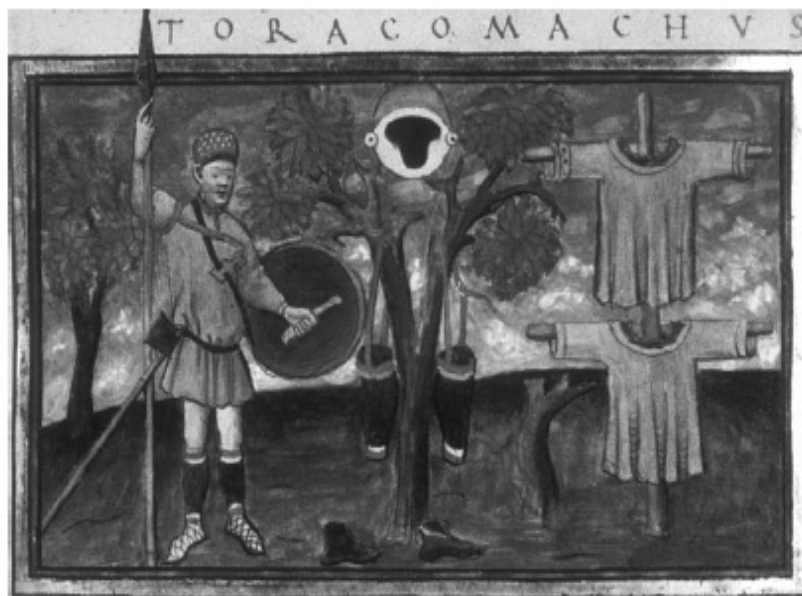
Infante tardorromano y su equipo, de un MS de De rebus bellicis

entrenada es esencial en las incursiones, hostigamientos, emboscadas y ataques nocturnos, o en cualquier operación en terreno accidentado, bosques o pantanos, circunstancias en las cuales la caballería debía desmontar y operar como infantería. A lo largo del período, la infantería romana fue muy competente en tales tácticas, operando en unidades de pequeño tamaño e infligiendo derrotas decisivas a enemigos dispersos mediante numerosas acciones menores sin tener que recurrir en absoluto a la batalla formal. La comparación entre la narración de Amiano Marcelino de las campañas contra los alamanes y los francos en el Rin en las décadas de 350-360, y los informes de Tefilacto Simocates sobre los combates irregulares contra los eslavos en el Danubio en la década del 590 sugieren una continuidad a largo plazo en las tácticas y capacidades operativas romanas al enfrentarse a enemigos y terrenos parecidos.